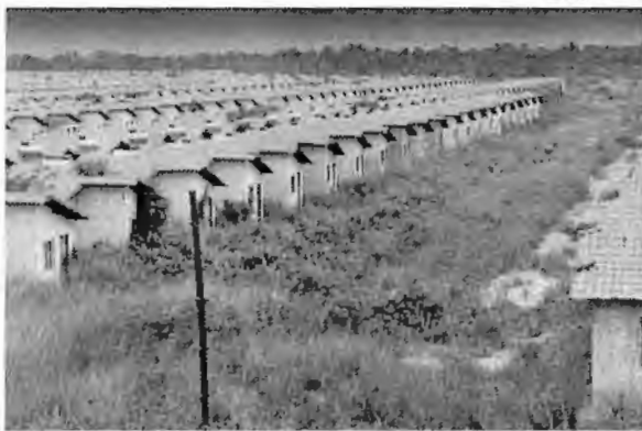
Mato toma conta do Residencial Canto do Serra, em Imperatriz, que se entregue beneficiaria 3 mil famílias

Procurado pela reportagem de O Estado, o Ministério das Cidades admitiu, por meio de nota, que o vídeo realmente refere-se ao empreendimento Canto da Serra.