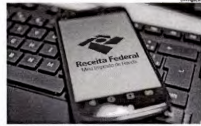
O programa da declaração do IR Pessoa Física já pode ser baixado

Disponível desde 2014 para os contribuintes com certificação digital (chave eletrônica vendida por cerca de R$ 200), a declaração pré-preenchida do Imposto de Renda será ampliada em 2021. A partir de