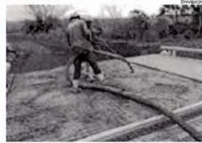
Maranhão recebe investimentos para construção de pontes

Após finalizar, o Sindicato das Empresas alega que "cabe ao prefeito Braide buscar o melhor para a população, o que inclui, além de uma passagem de ônibus justa e acessível, atuar para garantir o direito pleno e legítimo à mobilidade, proporcionando ao serviço meios para subsistir e livrando-o da ameaça de um colapso".