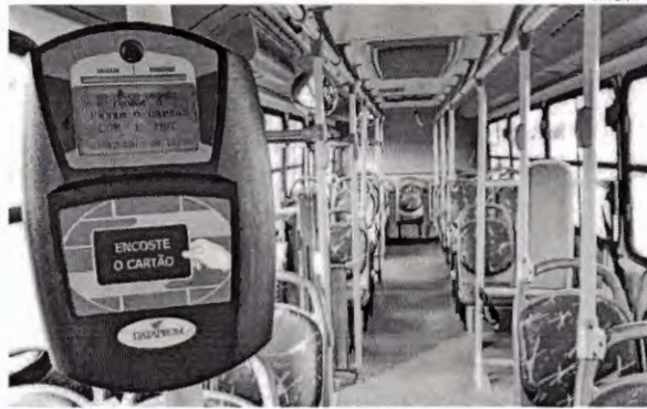
Sindicato das Empresas diz que tarifas do sistema de transporte urbano de São Luís estão defasadas

Os sucessivos reajustes de preços do óleo diesel aplicados pela Petrobras vêm exercendo forte pressão sobre as tarifas do transporte público de São Luís, que atualmente são de R$ 3,20 e R$ 3,70. É o que revela o Sindicato das Empresas de Transporte de Passageiros de São Luís (SET) considerando outros dois fatores que oneram o sistema: a ampliação de uma para duas horas do tempo concedido para uso do Bilhete Único e os custos com a reposição salarial da categoria dos rodoviários, cuja data-base é sempre o dia 1º de maio. Diante desse cenário, o realinhamento tarifário, que deveria ter sido concedido em setembro de 2020, torna-se inevitável, de acordo com o SET.