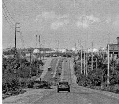
Moradores de bairros à margem da BR reclamam de insegurança

Com o objetivo de solucionar o problema nesse trecho da BR-135, que preocupa principalmente os moradores da zona rural da capital, ocorreu uma reunião, na tarde do último dia 18, no auditório da PRF, localizada na Vila Itamar. Além da PRF, participaram policiais militares, representantes do Departamento Nacional de Infraestrutura de Transportes (DNIT) e de várias comunidades ao longo