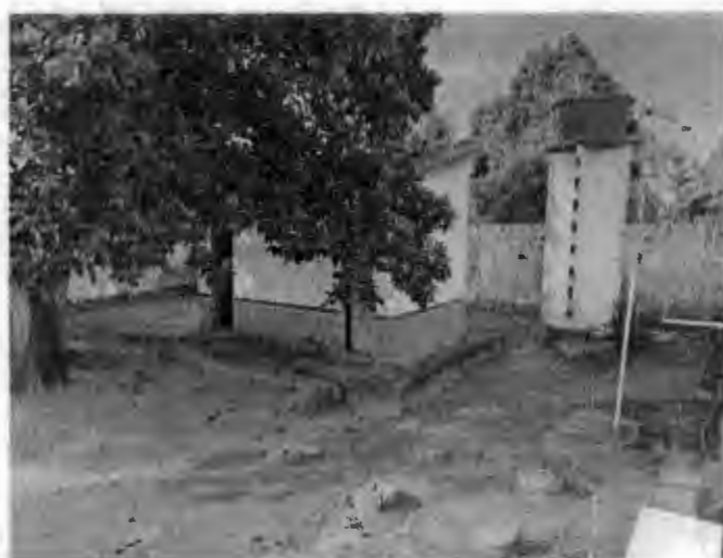
Banheiros da escola.