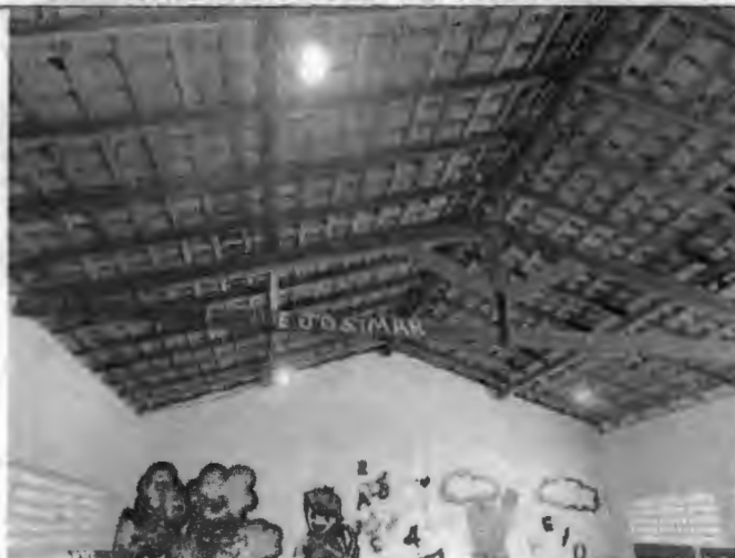
Vista interna de uma sala de aula, com destaque para a cobertura que precisa de reparos.

PODER EXECUTIVO PREFEITURA MUNICIPAL DE BURITIRANA DO MARANHÃO AV. SENADOR LA ROQUE, S/ N° - CENTRO - BURITIRANA DO MARANHÃO - MA CNPJ: 01.601.303/0001-22- CEP: 65.953-500