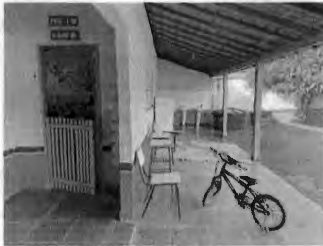
Circulação da escola.

PODER EXECUTIVO PREFEITURA MUNICIPAL DE BURITIRANA DO MARANHÃO AV. SENADOR LA ROQUE, S/ N° - CENTRO - BURITIRANA DO MARANHÃO - MA CNPJ: 01.601.303/0001-22- CEP: 65.953-500