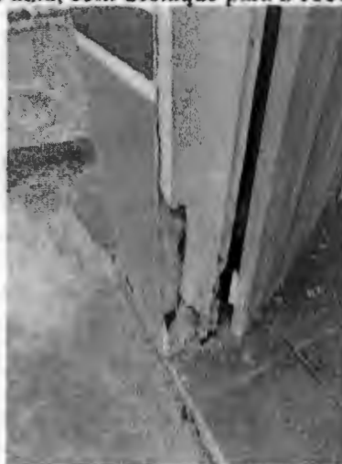
Portas com necessidade de reparos.