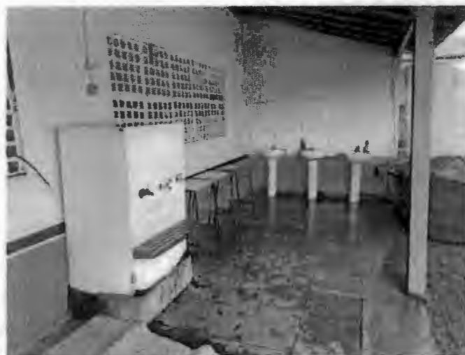
Área de higienização e bebedouro.