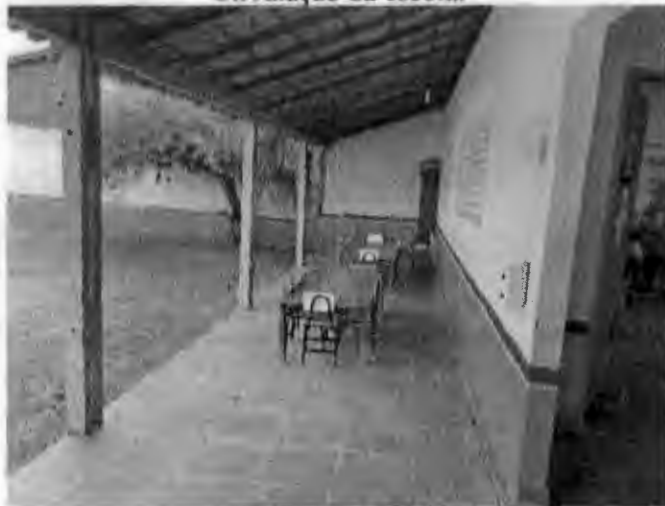
Circulação da escola.