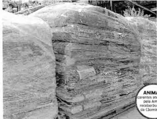
ANIMAIS carentes atendidos pela Amada receberam ração da Cãozinha

Dentre todos os eventos, a 6ª edição do Cãozinha Mirante FM bate o recorde no número de doações. Arrecadamos mais de duas toneladas de rações, que terão um bom destino. Este ano, o participante doou três quilos de rações para cães ou gatos. Entregamos todo o produto arrecadado à Amada, instituição importante que cuida de animais abandonados, que repassa, também, para outras entidades que desempe-