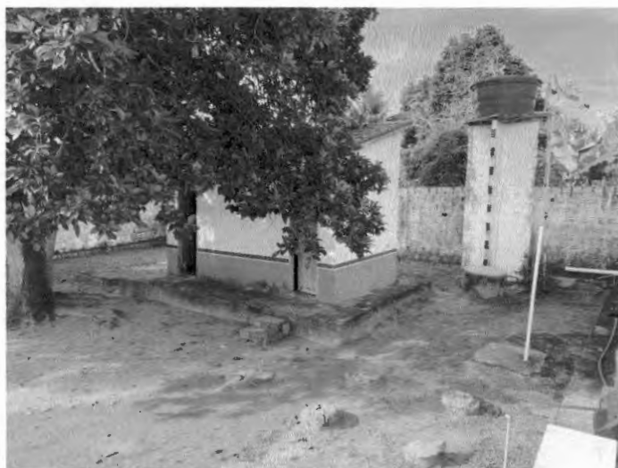
Banheiros da escola.