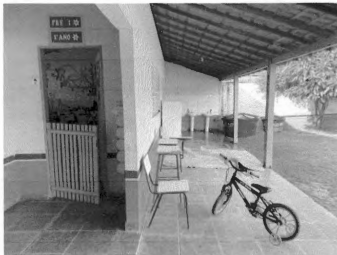
Circulação da escola.

PODER EXECUTIVO PREFEITURA MUNICIPAL DE BURITIRANA DO MARANHÃO AV. SENADOR LA ROQUE, S/ N° - CENTRO – BURITIRANA DO MARANHÃO - MA CNPJ: 01.601.303/0001-22– CEP: 65.953-500