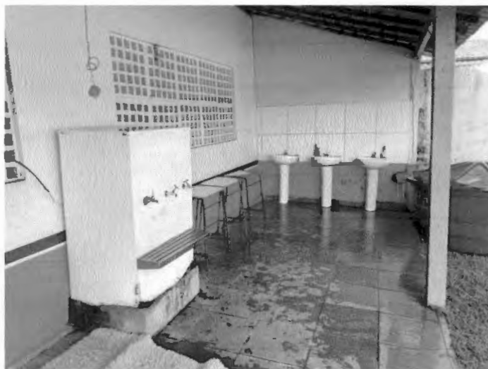
Área de higienização e bebedouro.

PODER EXECUTIVO PREFEITURA MUNICIPAL DE BURITIRANA DO MARANHÃO AV. SENADOR LA ROQUE, S/ N° - CENTRO – BURITIRANA DO MARANHÃO - MA CNPJ: 01.601.303/0001-22– CEP: 65.953-500