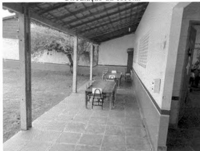
Circulação da escola.