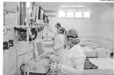
Em 2020 e 2021, foram realizadas 969 inspeções e 115 denúncias

Mudança Com a chegada da doença desconhecida, o Conselho Federal de Enfermagem (Cofen), se adaptou e mudou, com o passar dos meses, o seu manual de fiscalização. Com o decorrer do tempo, os conselhos passaram a fiscalizar somente as instituições especializadas no combate à Covid. "Recebemos muitas denúncias, especialmente, relacionadas a EPIs. Foi detectado um déficit muito grande em relação aos EPIs. Como nós não tínhamos normativas específicas, não se sabia exata-