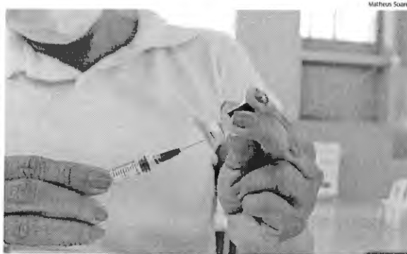
Para envio de doses das vacinas para os estados e municípios, é levada em consideração a população residente

Ontem, a Secretaria de Estado da Saúde (SES) informou que está orientando os municípios maranhenses a seguirem as recomendações do Ministério da Saúde (MS). E que, desde o dia 29 de agosto, orienta o que definiu nota técnica do Ministério da Saúde, ou seja, que a aplicação da segunda dose deve ser garantida indepen-