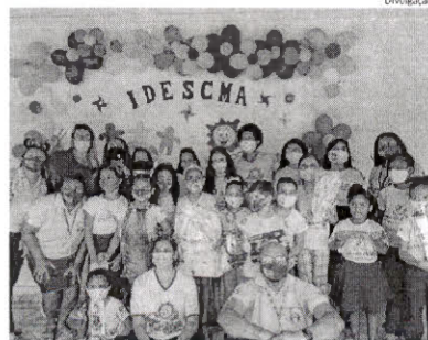
Ação do Idescma aconteceu no bairro São Raimundo, nesta semana