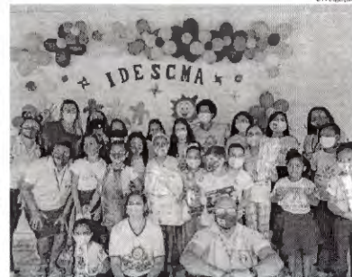
Ação do Idescma aconteceu no bairro São Raimundo, nesta semana