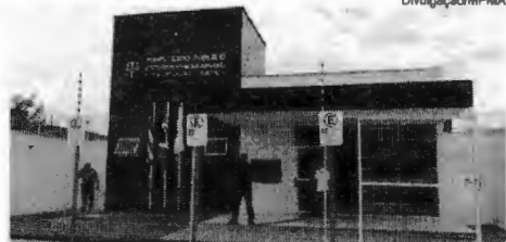
Novo prédio da sede das Promotorias de Coroatá

O procurador-geral de justiça, Eduardo Nicolau, inaugurou, na manhã desta quarta-feira, 4, a nova sede das Promotorias de Justiça de Coroatá. O novo prédio, localizado na Rua Nova, s/n, no Centro, tem 251,70m² de área construída e foi resultado de um investimento de R$ 875.914,03.