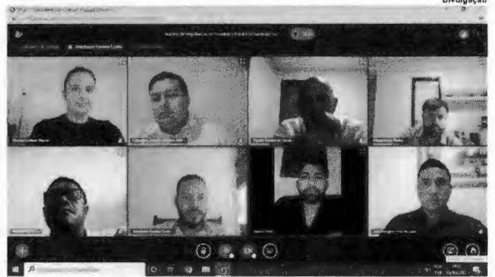
A mediação do Núcleo de Regularização Fundiária da CGJ foi decisiva para o avanço da concretização da REURB em Vitória do Mearim

TERMO DE COOPERAÇÃO TÉCNICA O passo seguinte será a assinatura de um Termo de