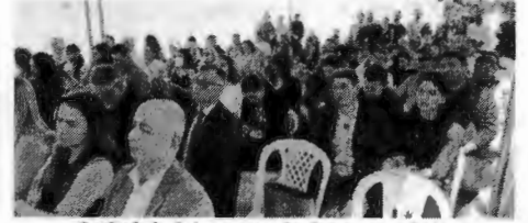
Cerimônia foi acompanhada por membros, servidores e comunidade de Coroatá