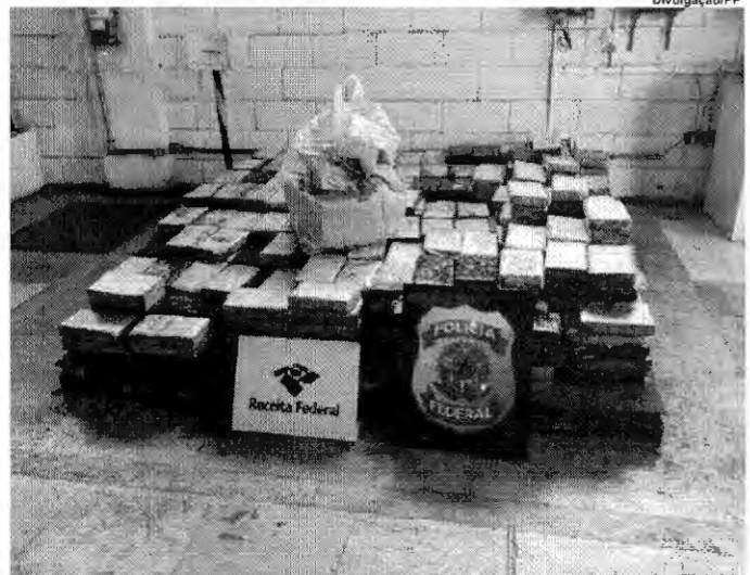
O entorpecente estava oculto em um contêiner depositado em um dos terminais do porto

O entorpecente foi apreendido pela PF, que realizou perícia no local dos fatos, a fim de subsidiar a investigação a ser conduzida em inquérito policial. (Comunicação Social da Polícia Federal em Santos/SP)