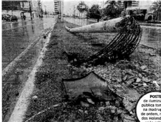
POSTE de iluminação pública tombou, na madrugada de ontem, na Av. dos Holandeses, após colisão

O número de acidentes de trânsito que resultaram em queda de postes, desde o primeiro dia de janeiro deste ano a 31 de março, aumentou 42% em relação ao mesmo período do ano passado, de acordo com o balanço divulgado pela Cemar. Ainda segundo a empresa, os acidentes com essas mesmas características tendem a se tornar mais comuns em períodos chuvosos, por causa do asfalto escorregadio, e que os dados, que continuam em linha vertical, são preocupantes, pois, além de ocasionar interrupção do fornecimento de energia quando o poste vai abaixo, pode, inclusive, causar danos à saúde dos ocupantes do veículo envolvido. Só neste primeiro trimestre, a Cemar contabilizou 526 acidentes