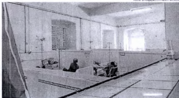
Paredes com mofo e descascadas; ambiente insalubre para mais de 50 pacientes, que ocupam uma das alas

"Isso é um completo descaço com os pacientes. Você entra doente aqui e sai mais ainda, pela sujei-