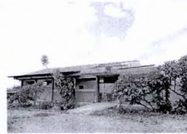
Obra em imóvel que serviu como escola está parada no Bairro de Fátima

informou que a primeira etapa de reforma foi iniciada no primeiro semestre de 2018, com a limpeza do espaço e adequação e melhoramento do telhado. Os serviços de adequação do prédio estão parados por causa do período de fim de ano, porém devem ser retomados já na próxima segunda-feira (7). Em reunião com lideranças do Bairro de Fátima, ocorrida em novembro de 2018, o Governo do Estado apresentou o andamento das obras e propôs a criação de uma comissão formada por lideranças comunitárias para acompanhar, junto aos representantes do governo, o andamento dos serviços de implantação do Centro. ■