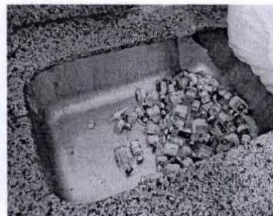
Frascos descartados em pia usada por pacientes e acompanhantes