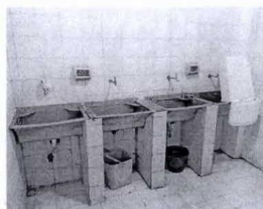
Tanques usados por pacientes e acompanhantes para higiene pessoal