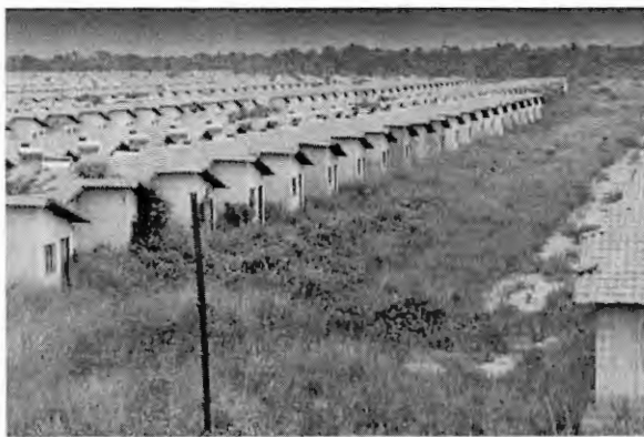
Mato toma conta do Residencial Canto do Serra, em Imperatriz, que se entregue beneficiaria 3 mil famílias

Procurado pela reportagem de O Estado, o Ministério das Cidades admitiu, por meio de nota, que o vídeo realmente refere-se ao empreendimento Canto da Serra -