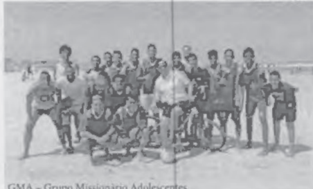
GMA - Grupo Missionário Adolescentes