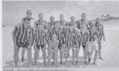
GMH - Grupo Missionário de Homens