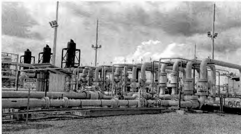
Unidade de Tratamento de Gás na Baía do Parnaíba, onde a Eneva concentra seu modelo de geração térmica integrada a campos produtores

"A PGN optou por declarar a comercialidade das áreas de Angical que estavam em estágio exploratório final. A porção remanescente seguirá em estudo e poderá ser declarada co-