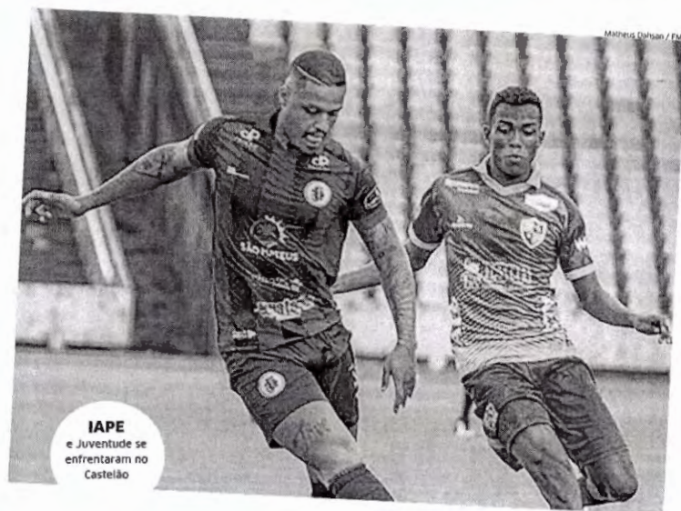
IAPE e Juventude se enfrentaram no Castelo

Moto e Juventude duelam por uma das vagas na final, com o Papão decidindo em casa, e Sampaio e Pinheiro fazem o outro duelo, e o Tubarão decide em SL