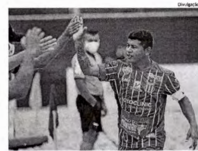
Maranhense Datinha já é velho conhecido nas convocações da seleção

de 3 x 0, porque no somatório dos resultados ficou em 3 x 2. Os gols da partida foram marcados por Bfreen aos 8 minutos do primeiro tempo e Kaká, aos 32 minutos do segundo tempo.