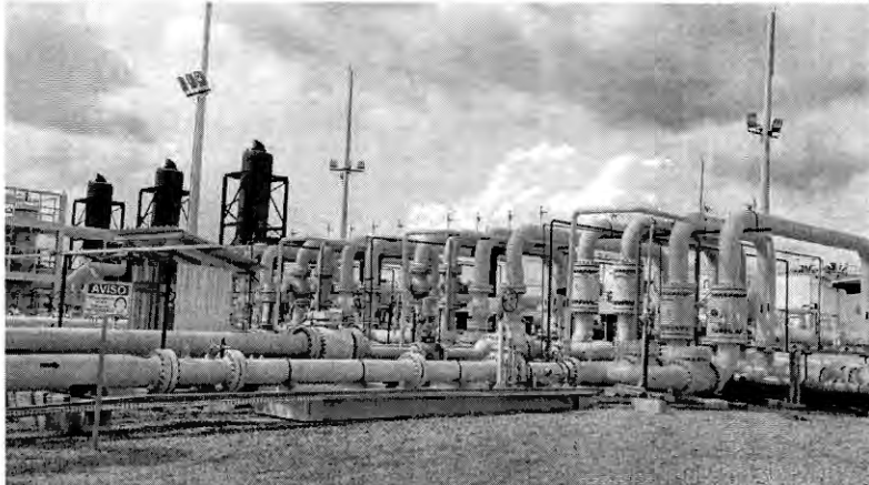
Unidade de Tratamento de Gás na Bacia do Parnaíba, onde a Eneva concentra seu modelo de geração térmica integrada a campos produtores

"A IGN optou por declarar a comercialidade das áreas de Angical que estejam em estágio exploratório final. A porção remanescente seguirá em estudo e poderá ser declarada co-