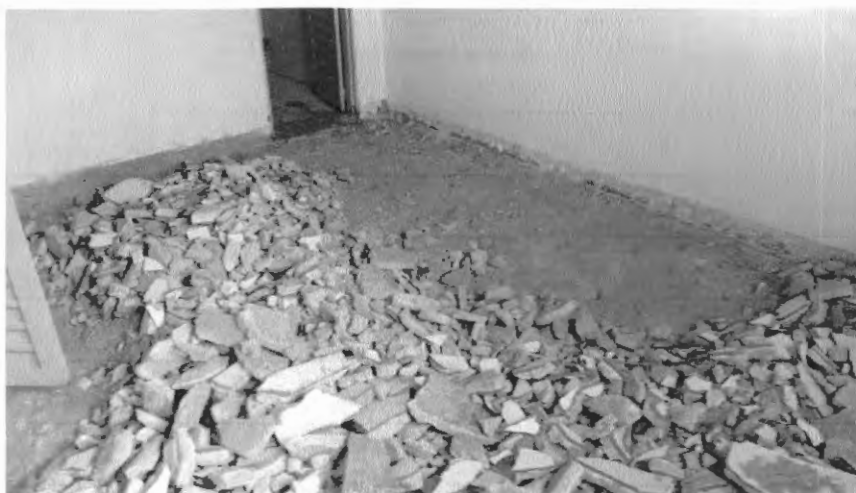
Demolição de contrapiso (na retirada do revestimento cerâmico viu-se a necessidade de trocar o contrapiso também).