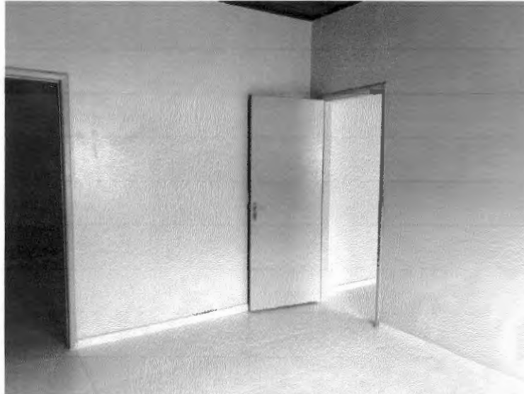
Rodapé cerâmico e alisares das portas

PODER EXECUTIVO PREFEITURA MUNICIPAL DE BURITIRANA DO MARANHÃO AV. SENADOR LA ROQUE, S/ N° - CENTRO - BURITIRANA DO MARANHÃO - MA CNPJ: 01.601.303/0001-22- CEP: 65.953-500