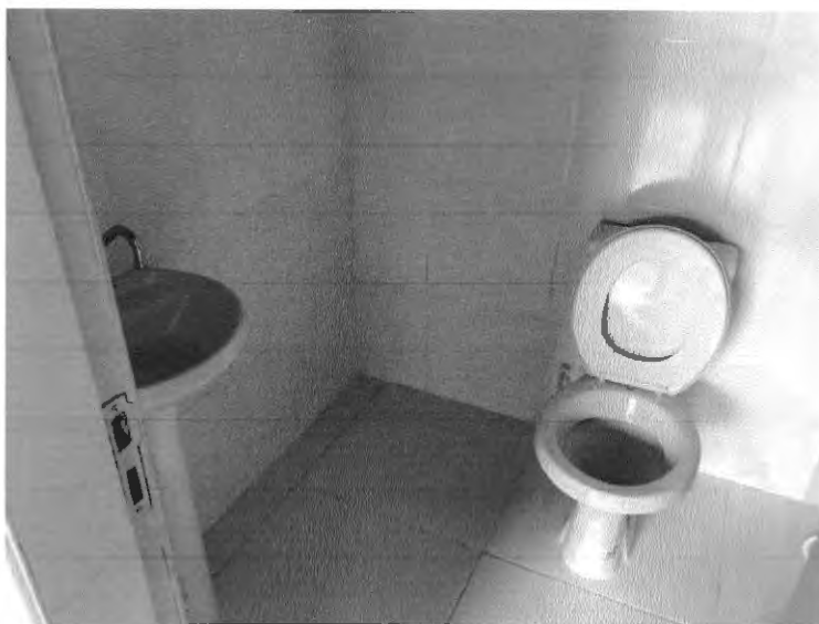
Substituição de louças sanitárias (vaso e lavatório) e revestimento cerâmico das paredes.