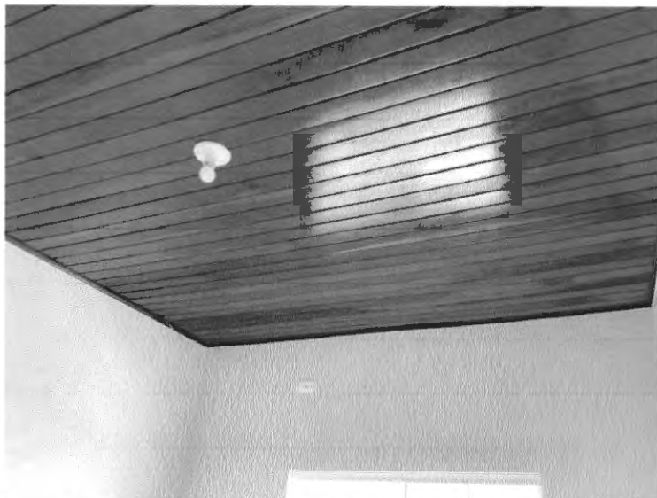
Pintura em madeira dos forros e substituição de lâmpadas (plafon)

PODER EXECUTIVO PREFEITURA MUNICIPAL DE BURITIRANA DO MARANHÃO AV. SENADOR LA ROQUE, S/ N° - CENTRO – BURITIRANA DO MARANHÃO - MA CNPJ: 01.601.303/0001-22– CEP: 65.953-500