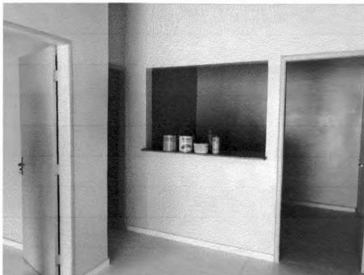
Rodapé cerâmico e alisares das portas