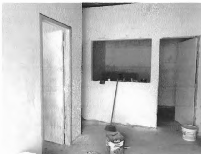
Confecção do novo contrapiso de concreto