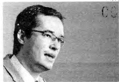
Deltan Dallagnol criticou atuação de ministros do STF na Lava Jato