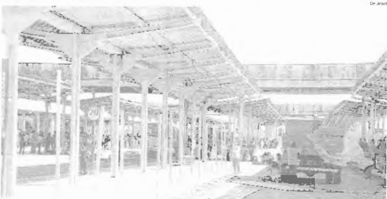
Tapumes de alumínio começaram a ser colocados ao redor das plataformas interditas ainda na tarde de ontem, para evitar acesso ao local

Magistrado também decidirá quando essa interdição total, caso seja confirmada, deverá acontecer; parte interdita já foi isolada por tapumes de alumínio