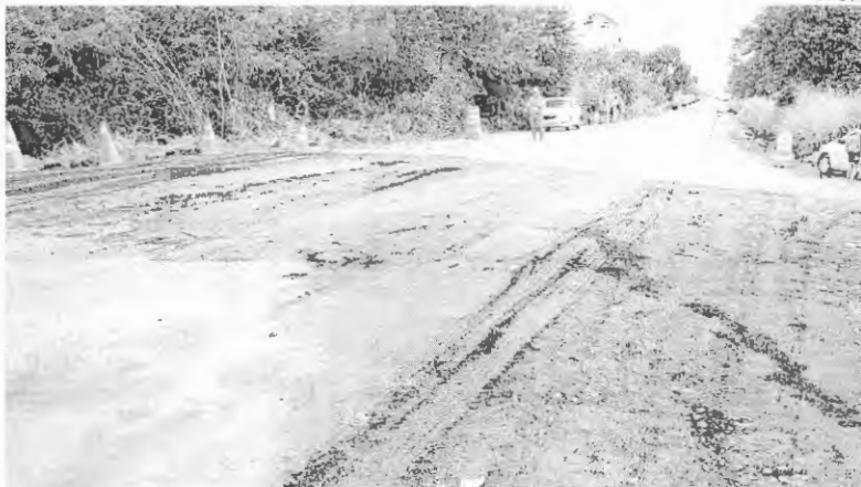
Trcho da BR-316, entre Zê Doca e Araguaçu, estrada foi parcialmente recuperada, mas precisa de obras, como outras que cortam o Maranhão

Pesquisa da CNT afirma que valor cobriria gastos emergenciais, manutenção e reconstrução: 213 pontos críticos foram identificados em rodovias do estado