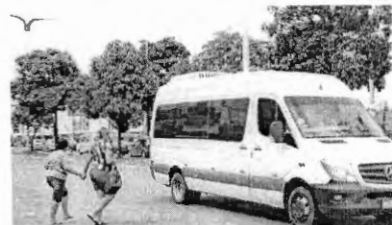
Com faixa apagada, condutores não param para os pedestres na via

A faixa, no Tirirical, onde a jovem passava, no momento do acidente está apagada, assim como diversas outras, espalhadas nas avenidas de São Luís