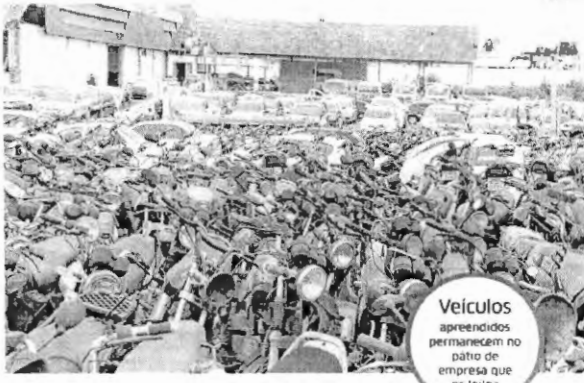
Veículos apreendidos no pátio de empresa que os levou